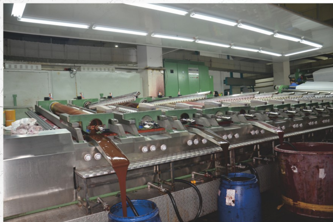
磁棒位于导带的上方，磁台位于导带的下方，磁台对着磁棒。它能保证圆网印花机上胶的均匀性，同时降低人工劳动强度，提高工作效率。 循环流动式供给色浆，可自动回收浆料，节省色料。