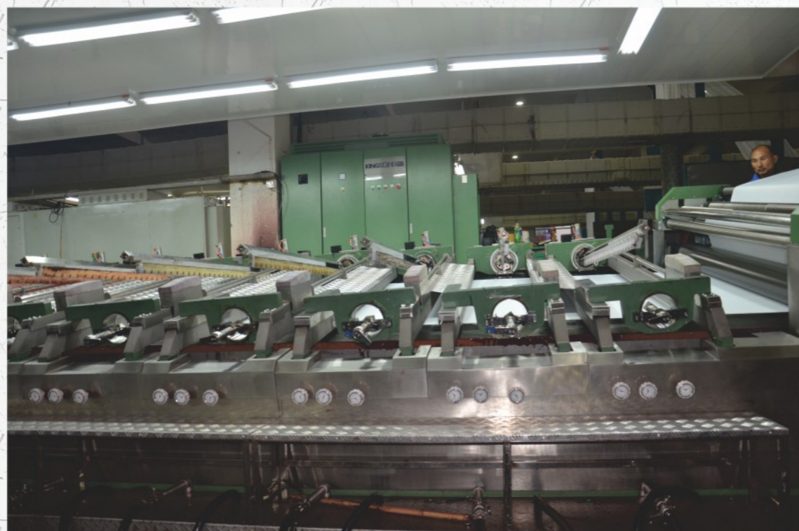
印花单元采用永久磁铁，不消耗电力，避免了因电压变动而引起的磁力波动，保证印花质量。